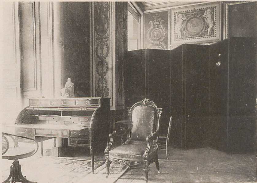
ASSEMBLÉE NATIONALE. — Cabinet du Secrétaire Général de la Présidence du Sénat