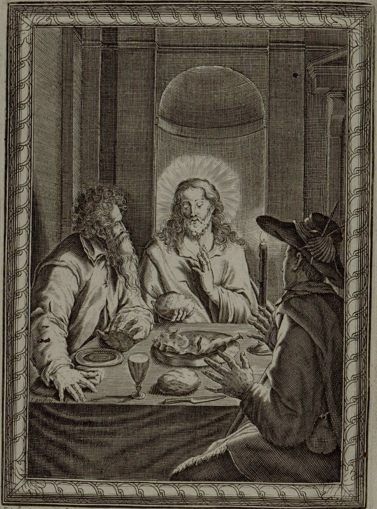
Et factum est, dum recumberet cum eis, accepit panem et benedixit ac fregit et porrigebat illis. Luc 24